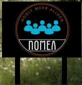
De vroom, Bertrand Russellaan 2a Madestein